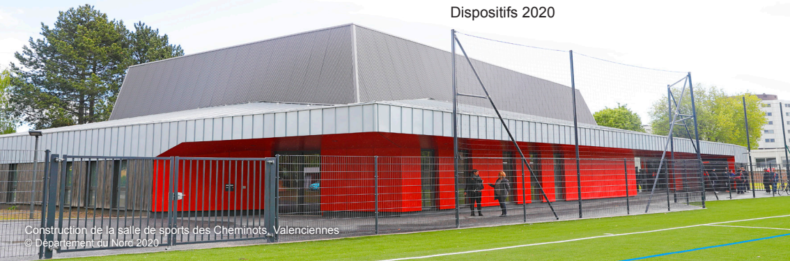
Construction de la salle de sports des Cheminots, Valenciennes