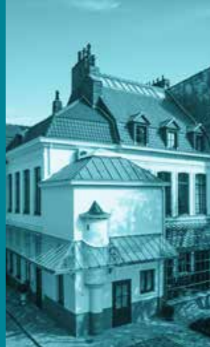
LA MAISON NATALE CHARLES DE GAULLE

La Maison natale Charles de Gaulle est un équipement culturel du Département du Nord. Le musée propose de découvrir la jeunesse et l'éducation de Charles de Gaulle.