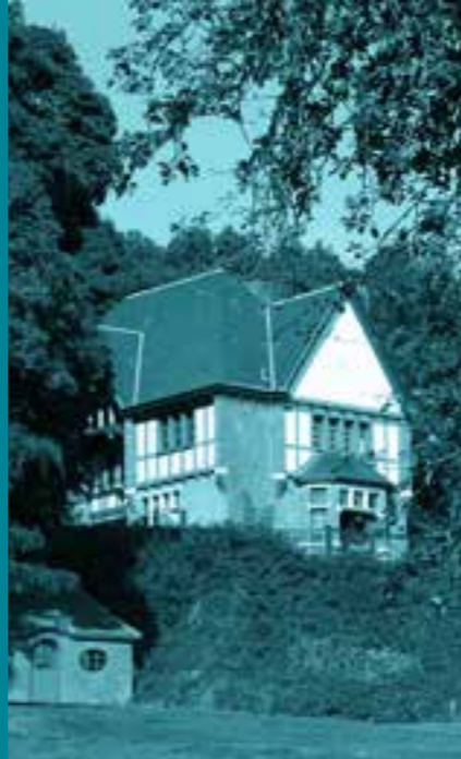
LA VILLA DÉPARTEMENTALE MARGUERITE YOURCENAR

La participation à ce concours implique l'acceptation complète de ce règlement. Le règlement peut être obtenu sur simple demande.