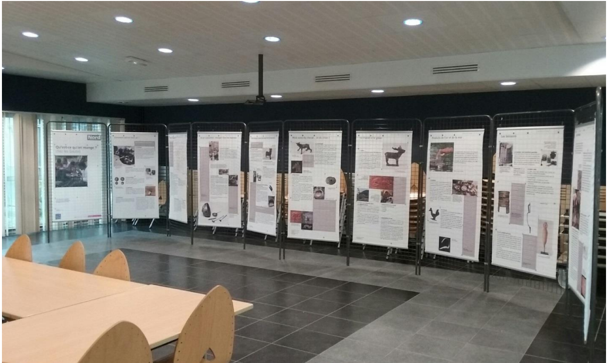
Prêt d'une exposition au collège de Pecquencourt

Les expositions sont prêtées gracieusement aux collèges du département qui en font la demande. En dehors des périodes scolaires, elles sont disponibles pour d'autres prêts : médiathèques, musées ... Ces expositions intéressent particulièrement les enseignants en lettres, en histoire et les documentalistes. Des questionnaires sont envoyés en amont par mail afin d'aider les enseignants à effectuer librement leurs visites.