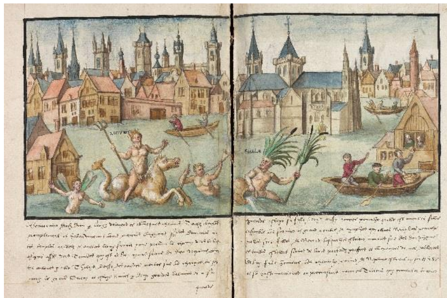
Douai, Bibliothèque municipale, ms 1183, t. III, f. 190v-191